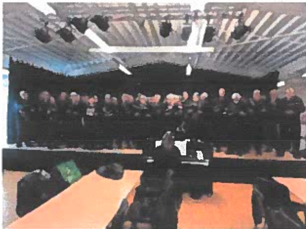
De 75 sangere på scenen i In Sides festsal bød på klimasange.