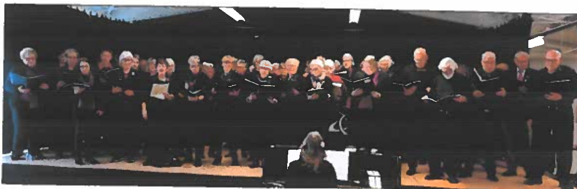
De 75 sangere på scenen i In Sides festsal bød på klimasange.