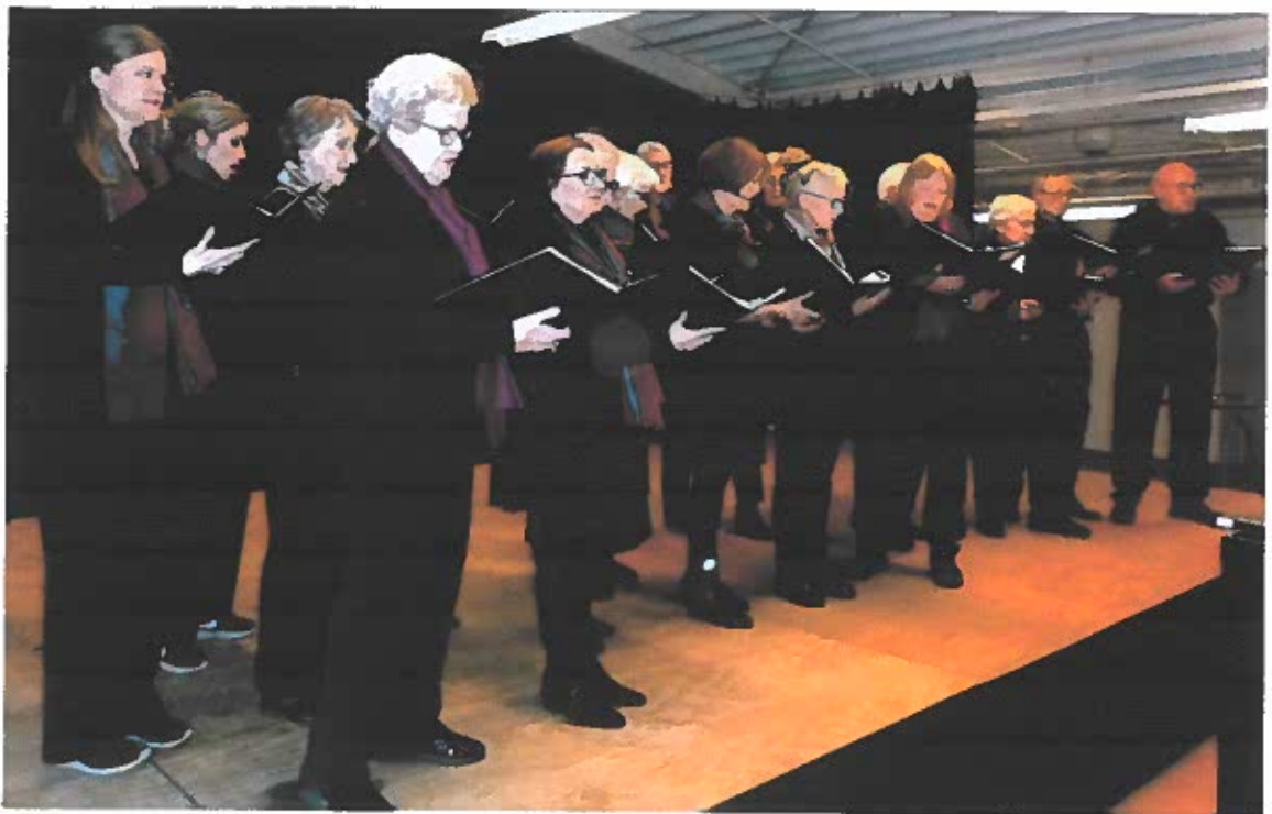
Hadsten Blandede Kor